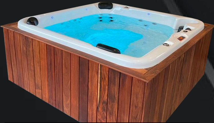
FALDÓN DE LÍNEA