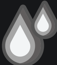
CAPACIDAD 1800 LTS